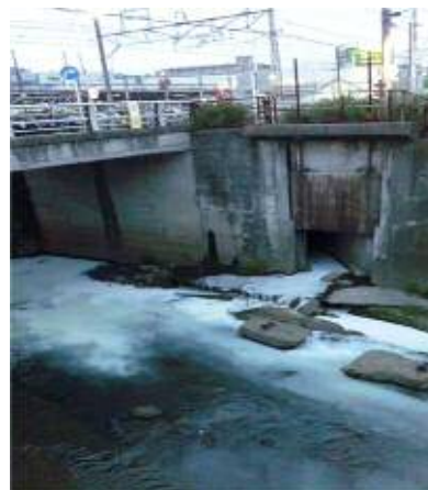
着色水により川が白濁した様子

事業活動に伴い発生した汚水については、適切な処理を行い、基準値に適合させるとともに、濁りや着色がないことを確認してから排出してください。また、塗料については産業廃棄物に該当しますので、産業廃棄物の許可業者等に委託するなどにより、適正に処分してください。