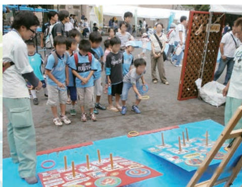
分別輪投げゲーム

低炭素・資源循環・自然共生の3つの環境配慮行動を呼びかけるために、こどもエコパークエリアを始めた4つのエリアで、子どもから大人まで楽しく学べる体験・参加型のイベントが開催されました。