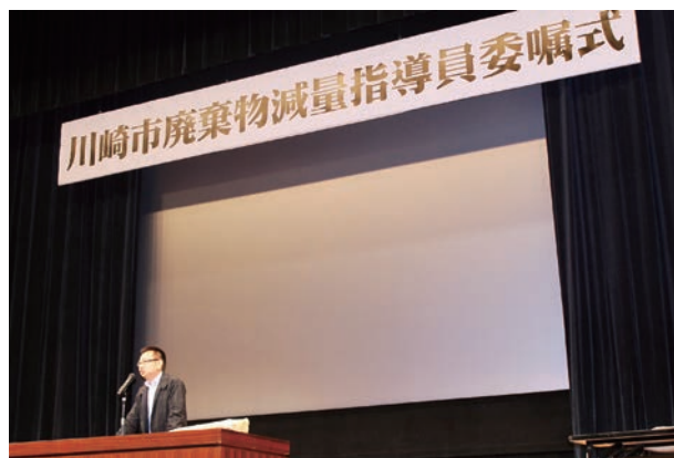
指導員活動の体験発表

平成24年5月に7区で川崎市廃棄物減量指導員委嘱式が開催され、それぞれ各地区の代表の方々に委嘱状を伝達させていただきました。