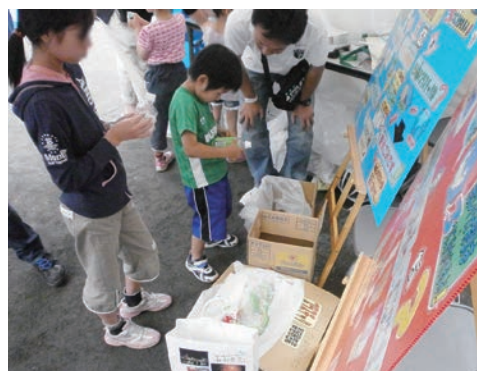
ペットボトルの分別にチャレンジ

資源循環チャレンジ行動の実践に向け、輪投げゲームを通して分別の大切さをお知らせしました。