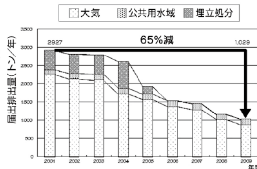
環境への総排出量の経年推移

※2003年度分の届出から届出事業所の対象物質となる年間取扱量の要件が5トンから1トンに引き下げられました。