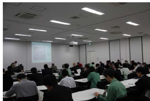
昨年度のセミナーの様子

環境総合研究所では、「環境セミナー」を開催します。このセミナーでは、「 かわさきの環境の歴史と新たな環境問題 」をテーマとして、今回は「 水環境 」を中心に、川崎市における公害の歴史、環境政策や環境技術について元市職員が当時を振り返るとともに、環境総合研究所における環境問題に対する現在の取組みについても講演をおこないます。環境について知りたい方や学びたい方は、ぜひ御参加ください！