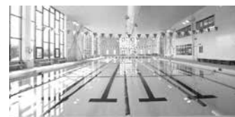
【ヨネッティー堤根】