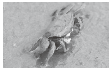
【干潟で見られるヤマトオサガニ】