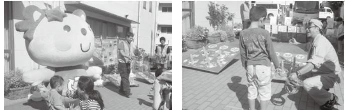
【3R推進イベントの様子】

一人ひとりが環境に配慮した、地球にやさしい循環型のライフスタイルを実践しましょう！