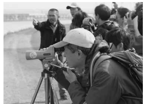
【川岸での観察の様子】

市ホームページ： http://www.city.kawasaki.jp/kurashi/category/29-3-8-0-0-0-0-0-0.html