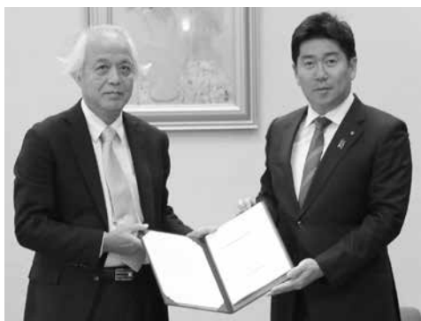
【市環境審議会から答申を受ける福田市長】

市ホームページ： http://www.city.kawasaki.jp/300/page/0000051000.html