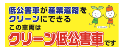
このステッカーがクリーン低公害車（ごみ収集車）の目印です。