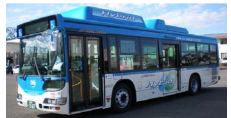
クリーン低公害バス （写真はハイブリッド車）

※産業道路周辺でゴミ収集作業を行う南部生活環境事業所の小型ゴミ収集車は全てハイブリッド車を導入済（環境局）