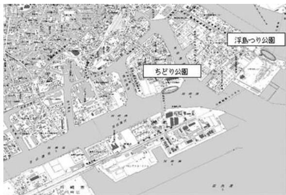
川崎港親水施設生物調査地点