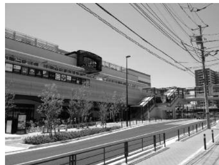
鹿島田駅西部景観計画特定地区

1994年12月に川崎市都市景観条例を制定するとともに、1995年度には、この条例に基づき川崎市都市景観形成基本計画を策定し、2011年度末までに、たちばな通り地区（1997年度）、新百合丘駅周辺地区（1998年度）、川崎駅西口大宮町地区（1999年度指定後、2007年度に景観計画特定地区に移行し、地区数から1減）、大山街道地区（2004年度）、武蔵小杉周辺地区（2013年度に景観計画特定地区に移行し、地区数から1減）及び新百合山手地区（2005年度）、新川崎地区（2006年度）、プレーメン通り地区（2008年度）、中原街道地区（2010年度）、川崎大師表参道・仲見世地区（2012年度）を指定し、合計8地区になりました。