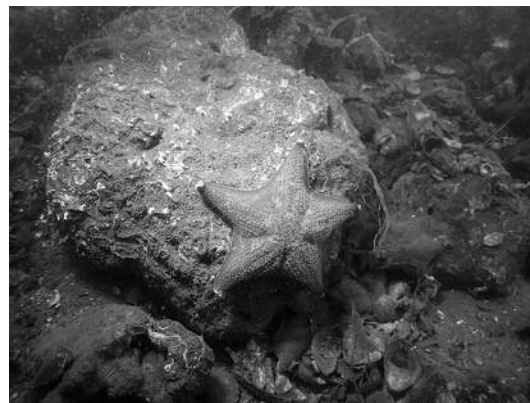
川崎港親水施設のイトマキヒトデ