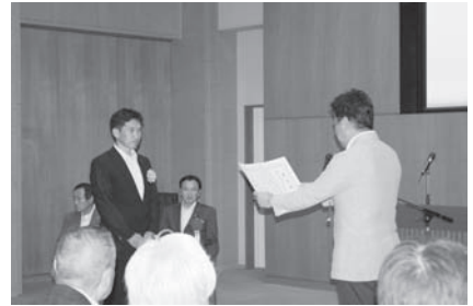
【昨年度の表彰式の様子】