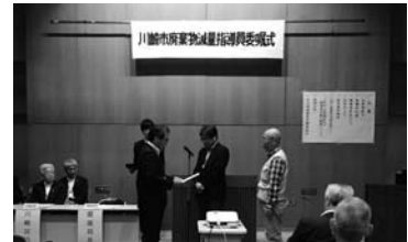
【川崎区の委嘱式の様子】

問い合わせ 環境局減量推進課 TEL 200-2580 FAX 200-3923