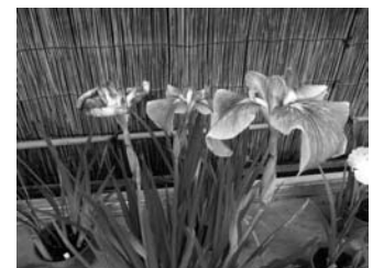
写真はハナショウブ品種展 江戸時代から続く伝統の園芸植物です

【展示会】「ハナショウブ品種展」平成 28 年 6 月 7 日 (火) ～ 6 月 19 日 (日) 9 時～ 16 時 30 分