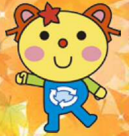
かわさき3R推進キャラクター かわるん