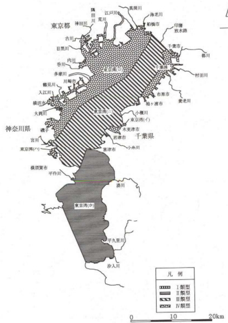
図2 東京湾環境基準類型指定概況図 (全窒素及び全磷)