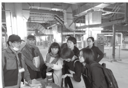
【平成 29 年の環境技術研修視察の様子】

川崎市は瀋陽市と昭和 56 年に友好都市を締結し、環境・経済・文化・芸術など様々な分野で交流を重ねています。平成 9 年からは、環境技術研修生を受け入れ、川崎市の環境行政や先進的な環境技術について学んでいただくことで、瀋陽市の環境施策の推進に貢献し、環境分野での交流を通じて友好関係を一層深めています。