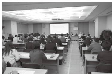
【平成 29 年のフォーラムの様子】

1 ページ目の川崎市とバンドン市による取組も、この「アジア・太平洋エコビジネスフォーラム」の活動等をきっかけに始まりました。