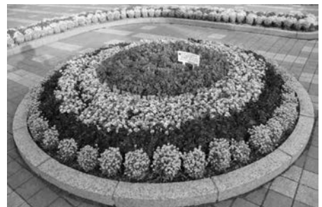
【生ごみ堆肥で育成している花壇】