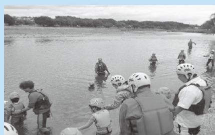
【5月の安全教室の様子】