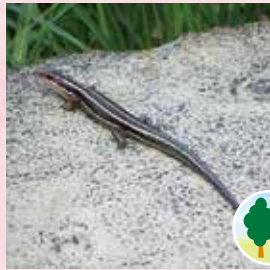
ヒガシニホントカゲ