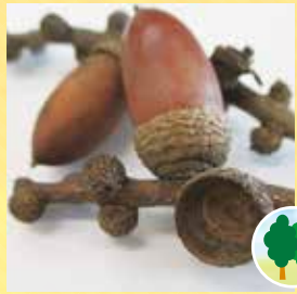
ドングリ (マテバシイ)