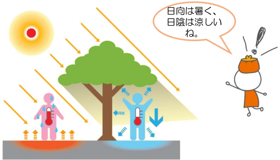
日向と木陰の体感温度の違いのイメージ