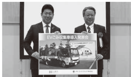
EVごみ収集車導入発表会の様子

問い合わせ：環境局廃棄物政策担当 TEL 200-3721 FAX 200-3923