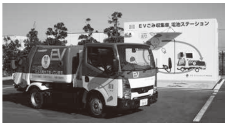
EVごみ収集車と電池ステーション