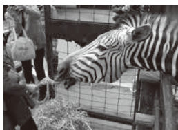
ヤマシマウマのエサやり体験