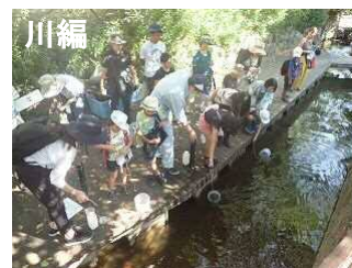
水辺のフィールドワーク