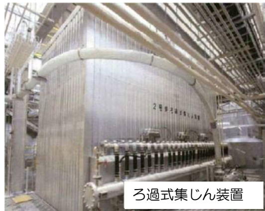
ろ過式集じん装置