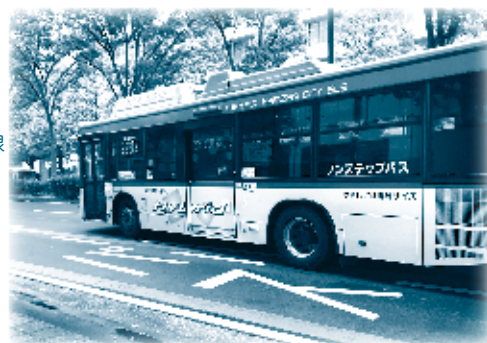
環境にやさしい市バス（ハイブリッドバス）

大気環境改善のため、産業道路はなるべく迂回し 早くて便利な湾岸線等を利用しましょう