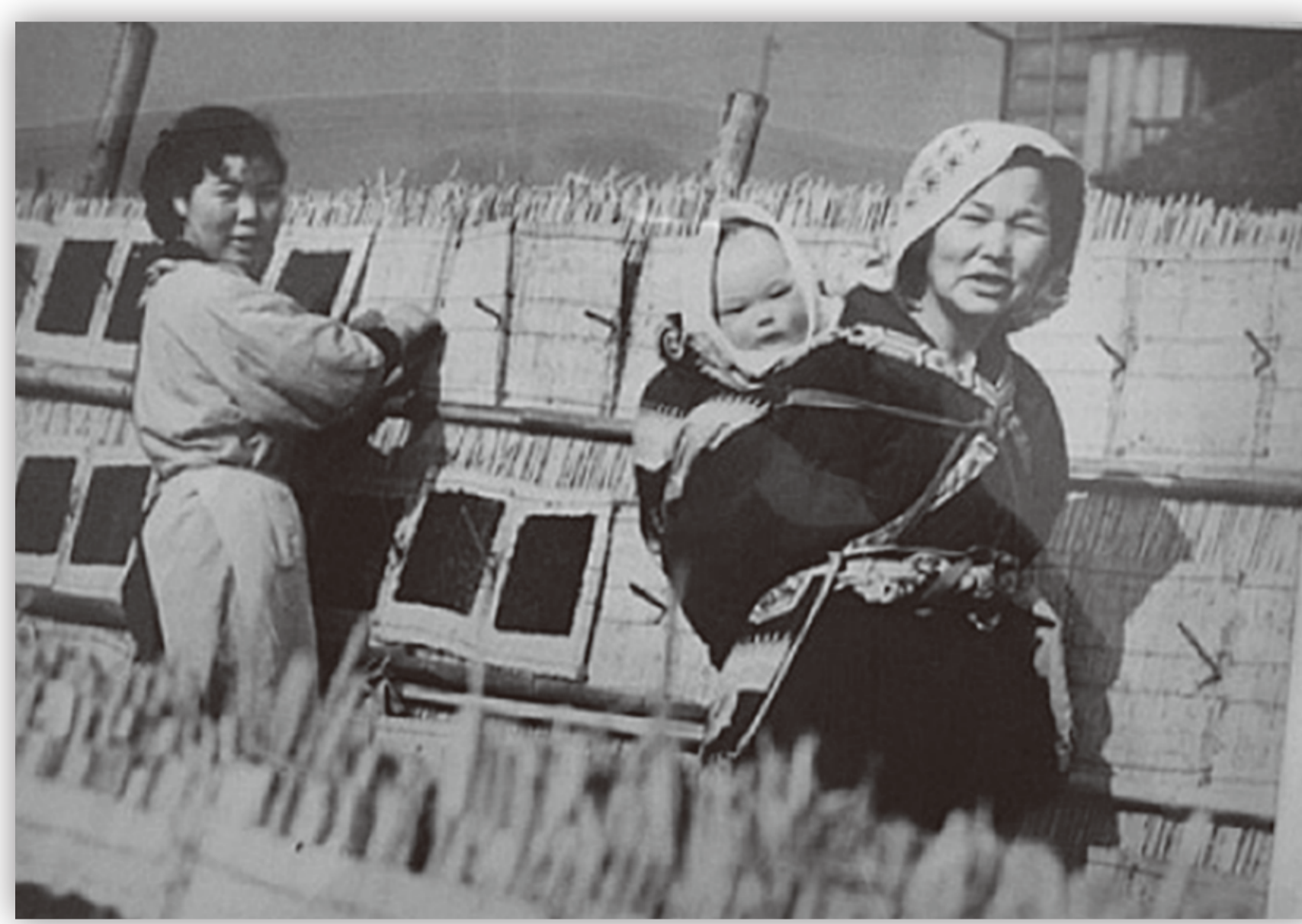
海苔の天日干し 川崎港管理センター