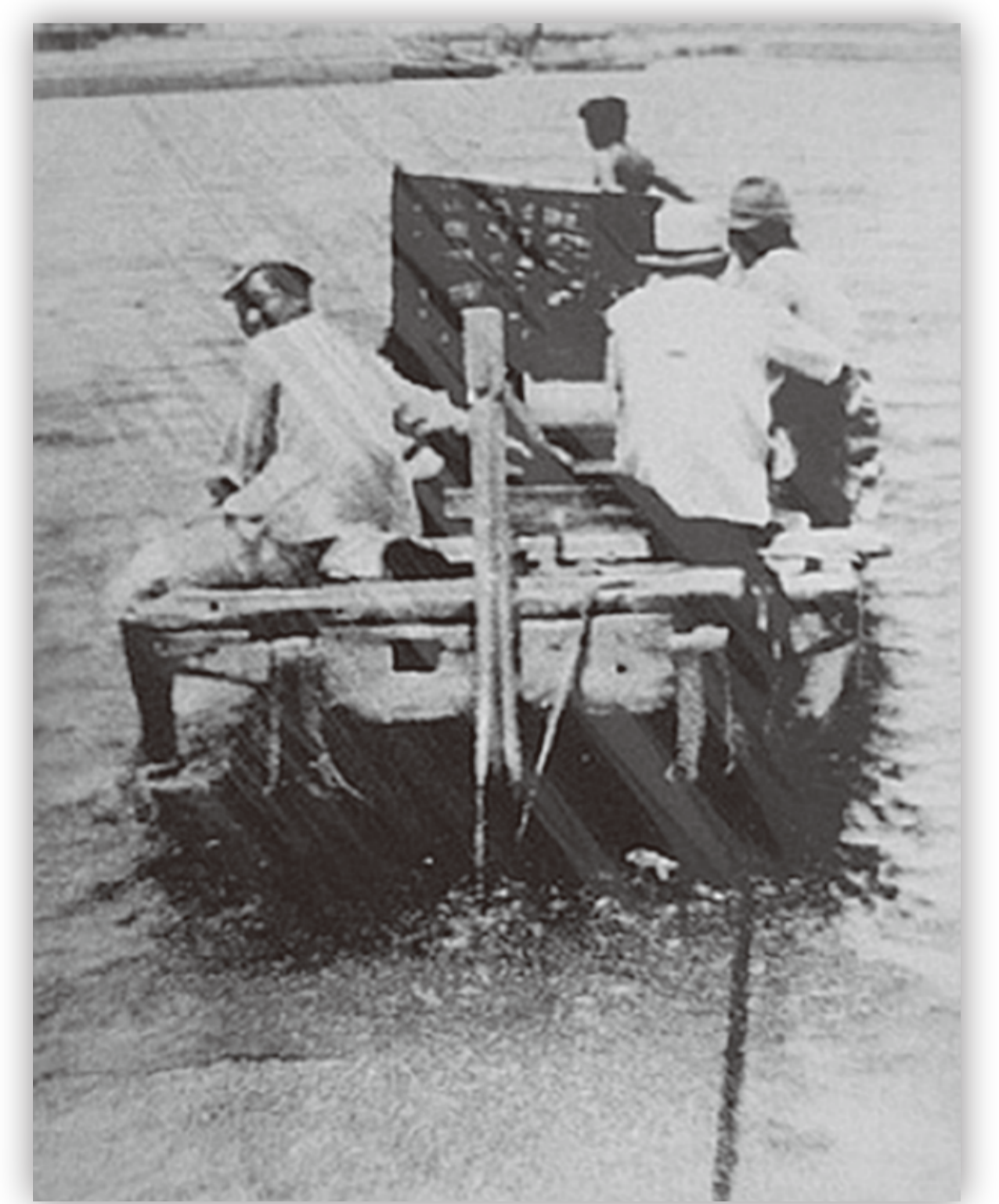
東京湾川崎沖の貝巻き舟 川崎港管理センター