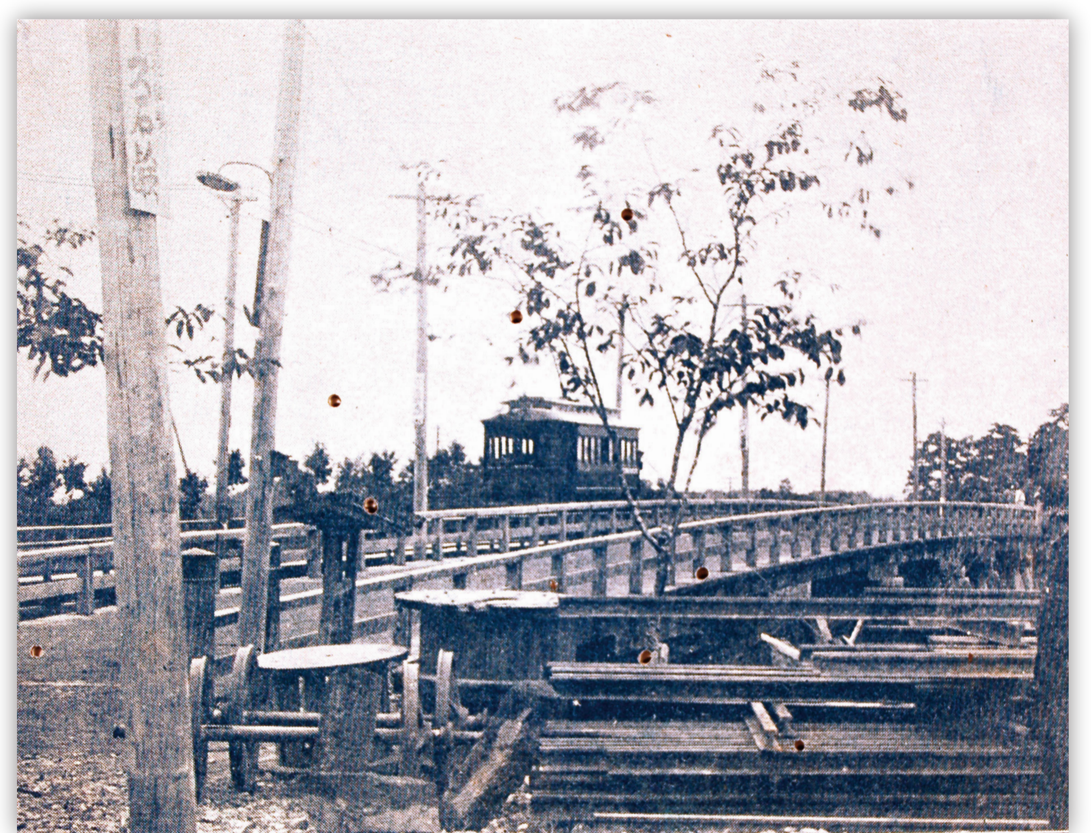
京浜電気鉄道 川崎市市民ミュージアム

川崎における鉄道の歴史は古く、1872（明治5）年に新橋－横浜間の鉄道が開通すると、川崎に停車場がつけられました。1899（明治32）年には、東日本初の電気鉄道である大師電気鉄道（現京急大師線）が開通し、その後、京浜電気鉄道（大師電気鉄道が社名変更・現京浜急行電鉄）、武蔵電気鉄道（現東急電鉄）、京王電気軌道（現京王電鉄）、小田原急行鉄道（現小田急電鉄）、南武鉄道（現JR南武線）、鶴見臨海鉄道（現JR鶴見線）が次々と開通しました。特に、省線（現JR東海道線）と京浜電気鉄道は横浜や東京から多くの人を川崎に集め、南武鉄道は多摩川の砂利と奥多摩のセメント原料を運びました。これらの川崎を縦断、横断する鉄道は、乗客とともに工場の原料や生産物の輸送に力を発揮し、川崎の発展に大きく貢献しました。