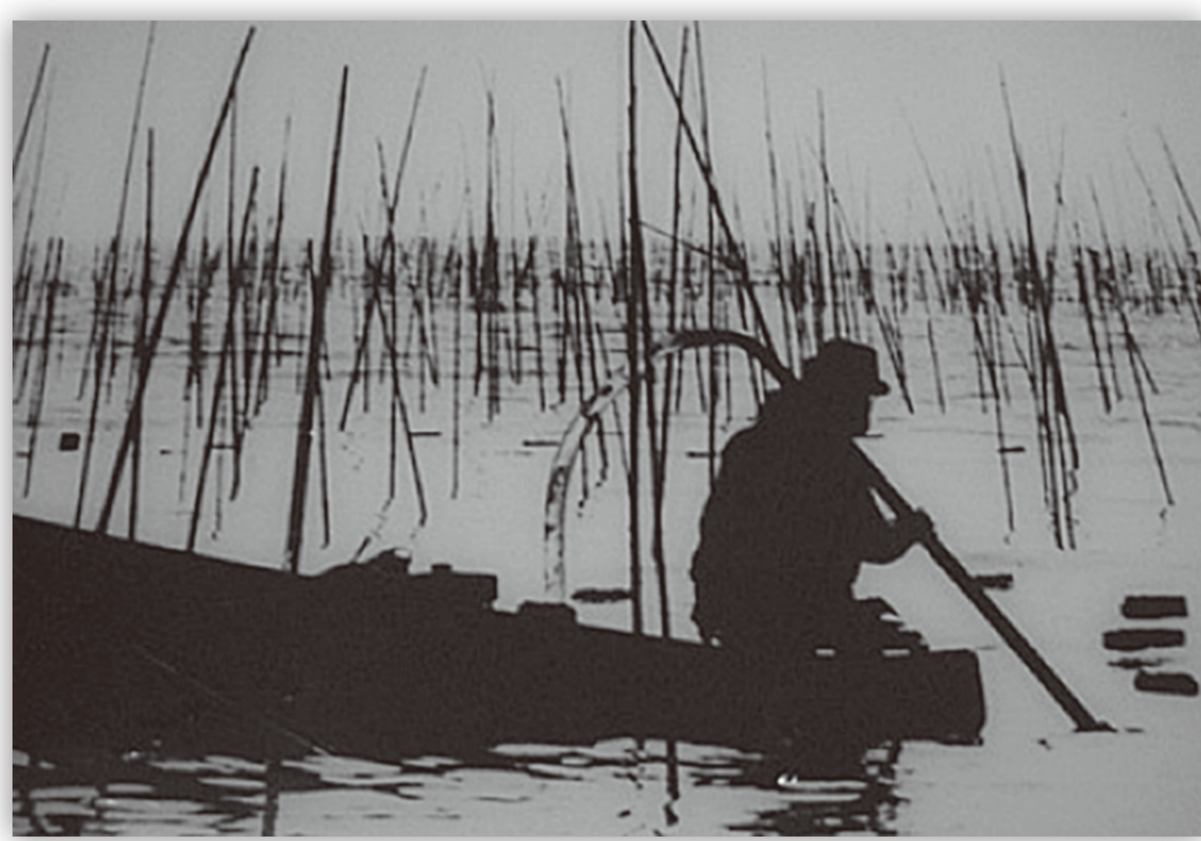
大師海苔の収穫 川崎港管理センター

明治時代、現在の川崎市は多くの町と村に分かれていました。ほとんどは農村で、主要産品は米でしたが、海に近い地域では、稲作とともに梨や桃などのくだもの栽培、塩づくりも行われていました。また、沿岸部には魚介類が豊富な遠浅の海が広がっており、アサリやハマグリ、アオヤギなどの貝類がとれました。1871（明治4）年に始まった海苔の養殖は「大師海苔」として県内最大の生産量を誇り、沿岸部の人々は冬に海苔を作り、夏はくだもの栽培や稲作を行う生活をしていました。