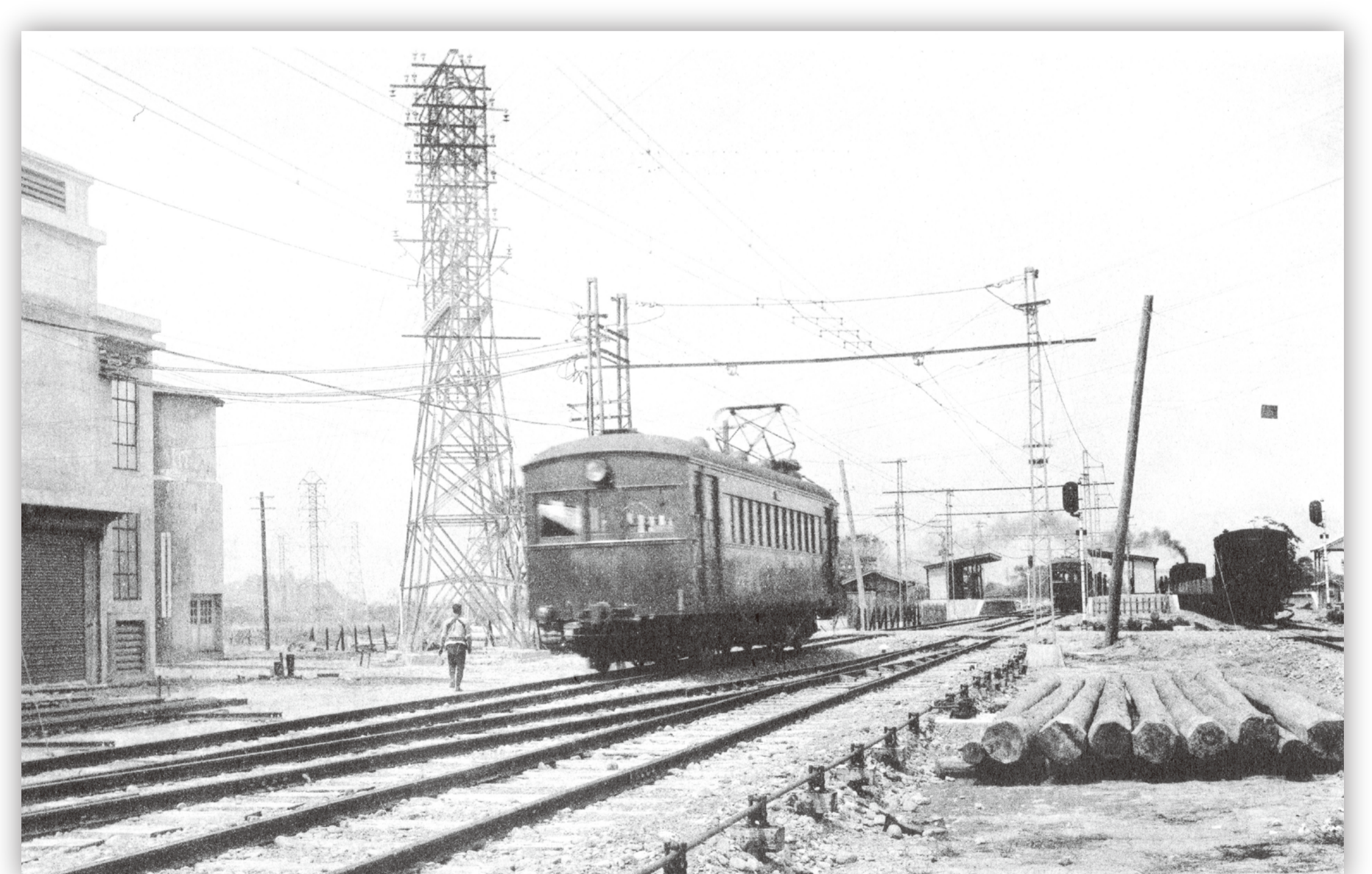
南武鉄道 川崎市市民ミュージアム