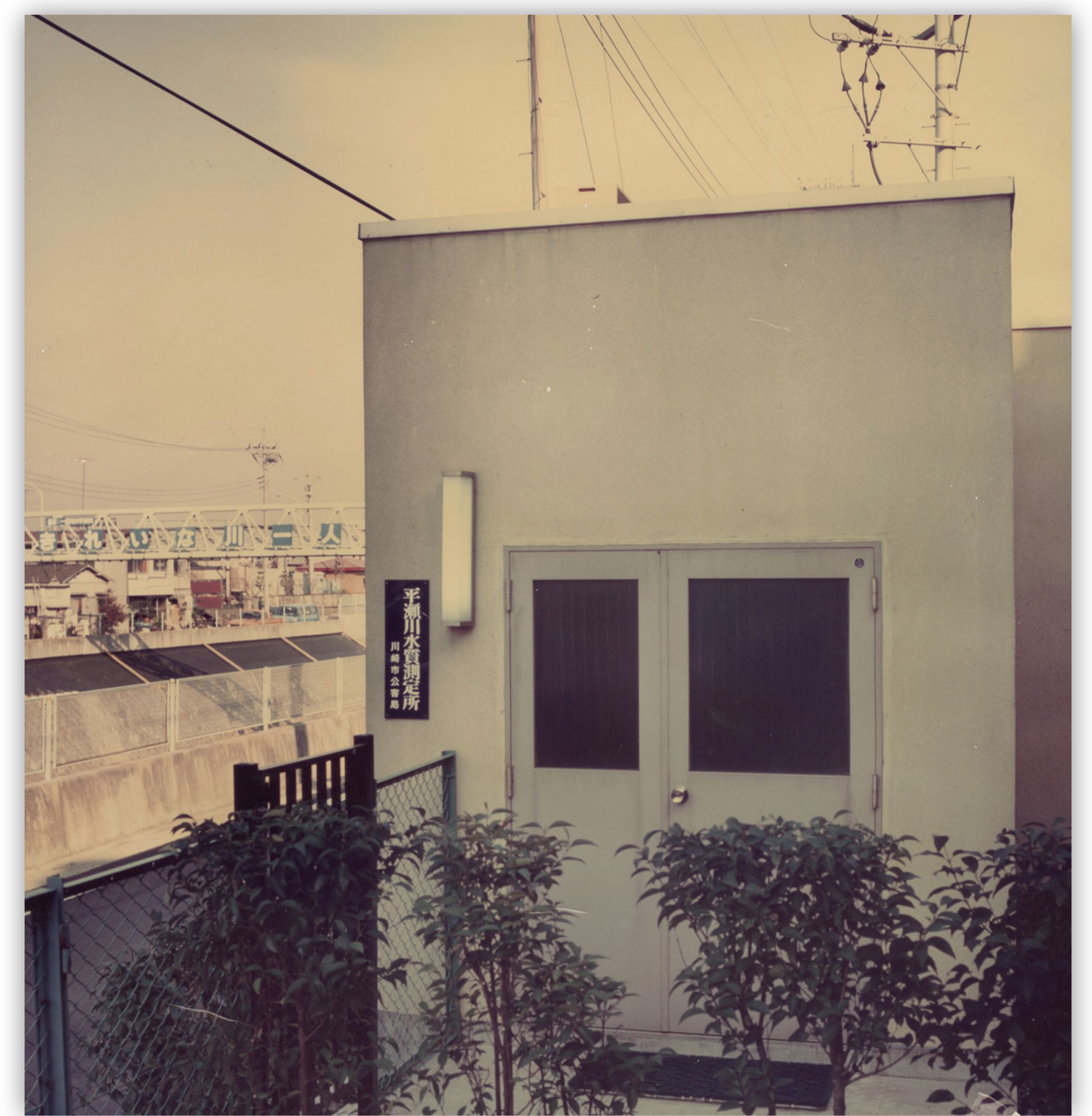
平瀬川水質測定所

市内河川の水質を常に把握するため、1981（昭和56）年、平瀬川（高津区）に環境水質測定所を設置し、その後も同様の測定所を設置しました。同時に、下水道の整備や生活排水対策を進めました。また、川崎市公害研究所では、食品由来の生活排水による川の水質汚濁負荷を把握する調査や生物調査などを行うとともに、生活排水が川や海の汚れの原因になることを伝えるパンフレット制作や環境学習教室の開催など、市民への普及啓発も行いました。こうした様々な取組により、市内の水環境は大きく改善しました。