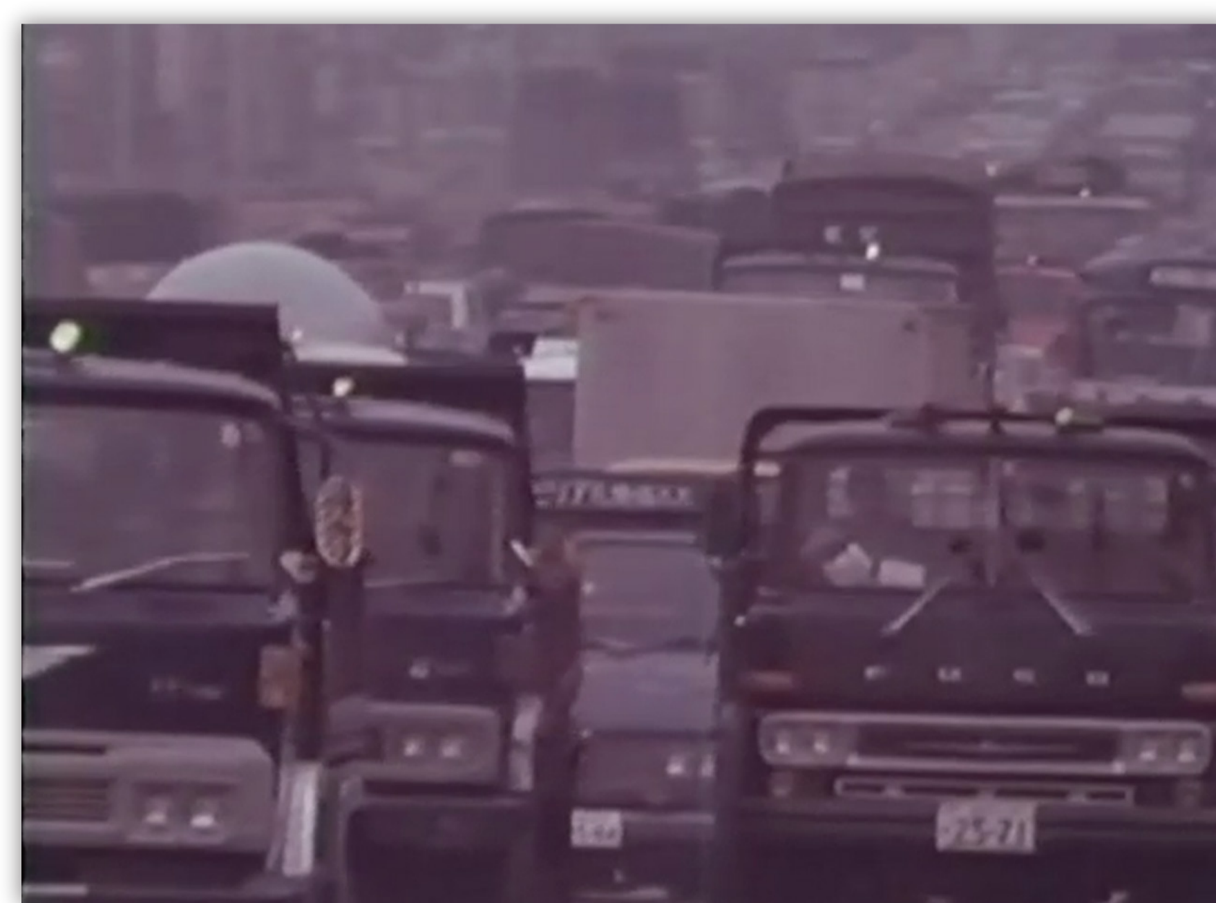
交通量の多い道路の様子

自動車の交通量増加により、排出ガスに含まれる窒素酸化物（NOx）や粒子状物質（PM）による大気汚染が大きな問題となりました。当時は、工場や事業場に対する規制はありましたが、自動車の排出ガス対策は遅れていました。