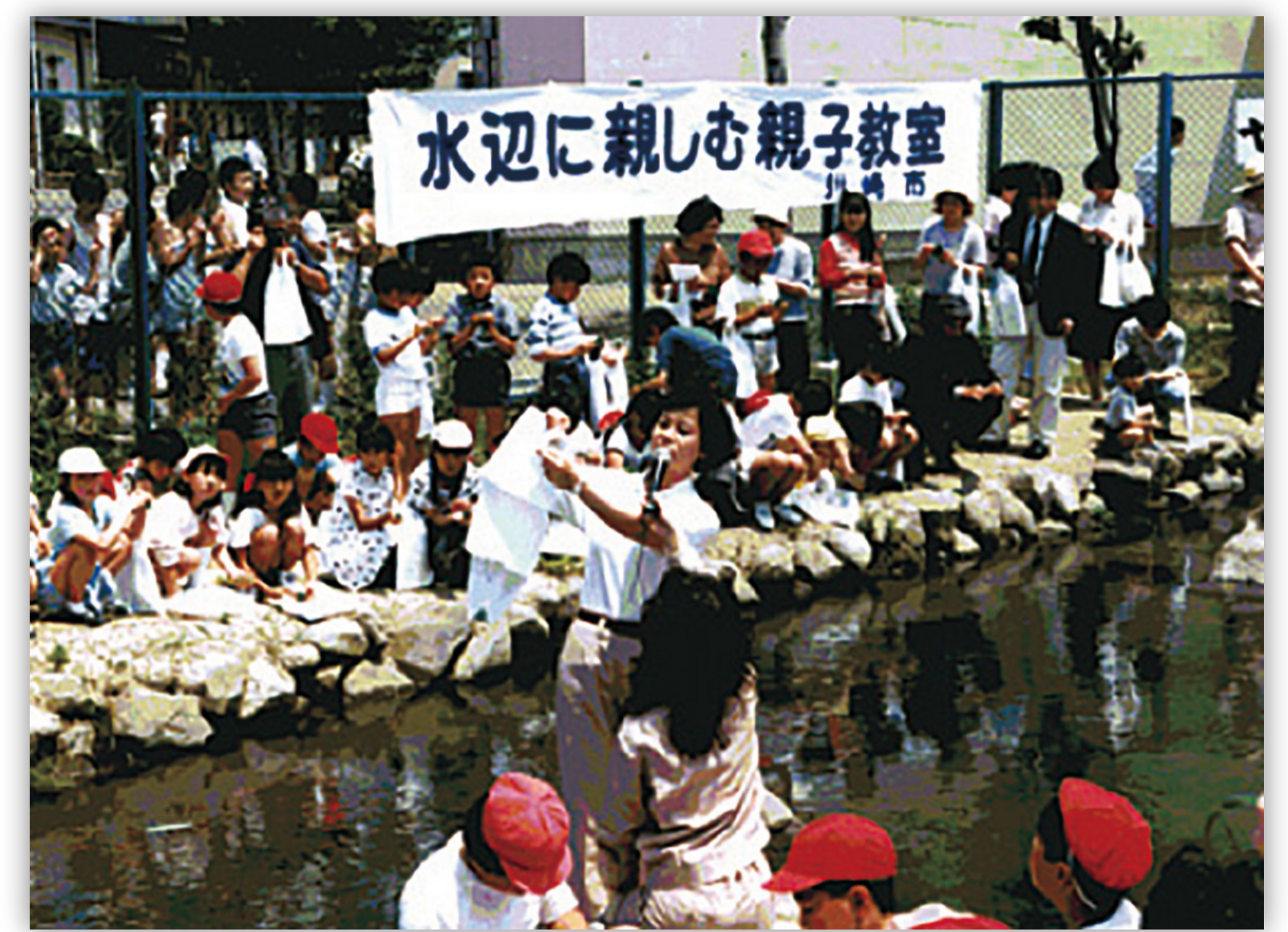
水辺に親しむ親子教室