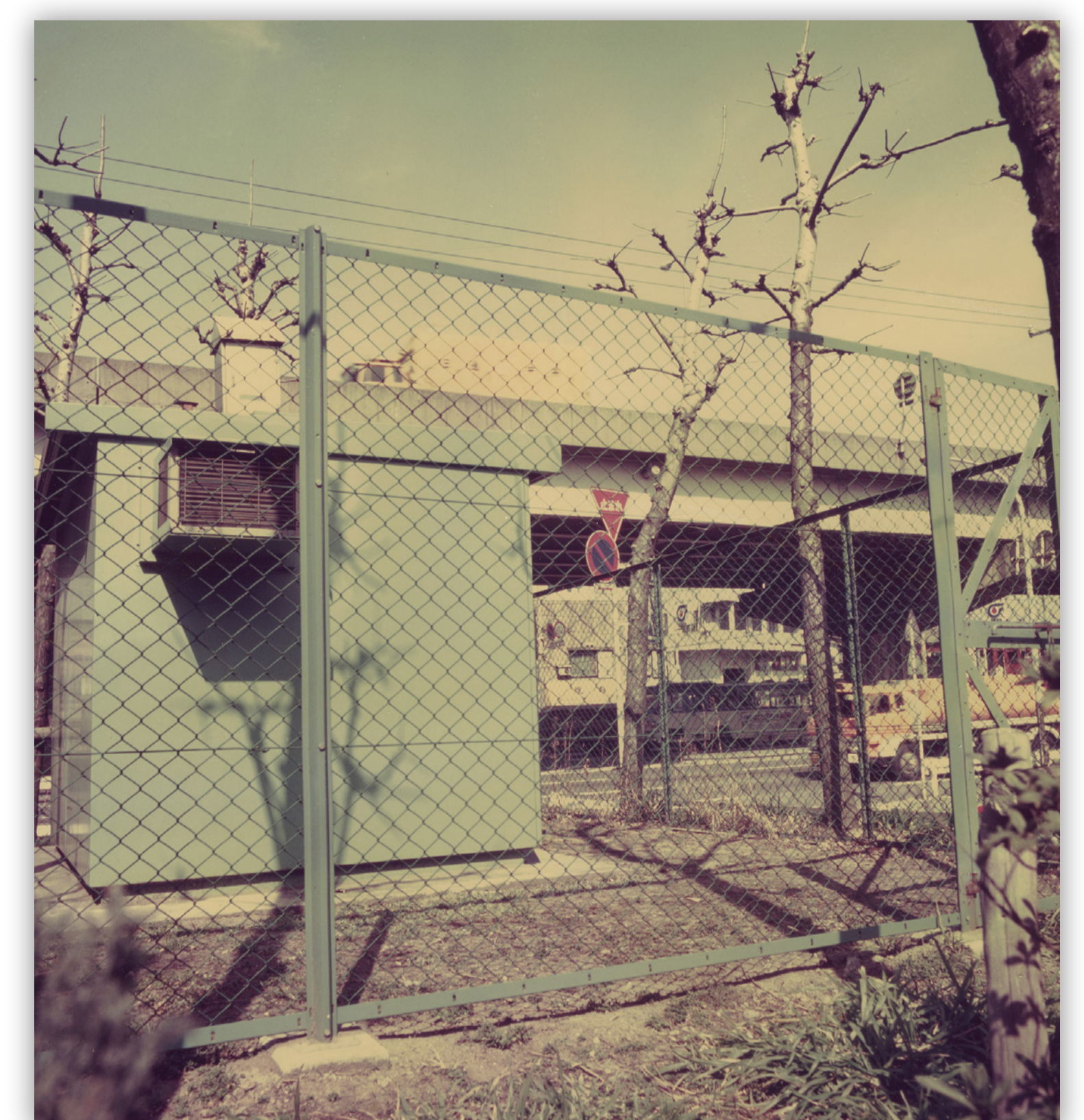
池上自動車排出ガス測定所

そのなかで1991（平成3）年に「川崎市自動車公害防止計画」を策定し、低公害車の普及促進、交通量抑制対策の推進、交通量の多い道路沿道に植物を植えるグリーンウォール事業などを行いました。また、首都圏の自治体と連携して「水曜日ノーカーデー」の取組などをすすめました。