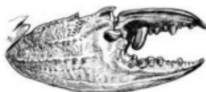
イシガニの右と左のはさみ