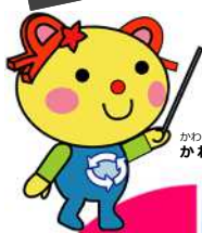
かわさき3R推進キャラクターかわるん

日本では年間570万トンもの食品ロスが発生しています。これはなんと国民1人1日あたりお茶碗1杯分のご飯を捨てているのと同じ量に相当します。