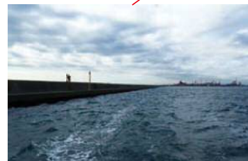
③ 東扇島防波堤の内側