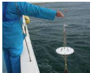
透明度を調べる道具