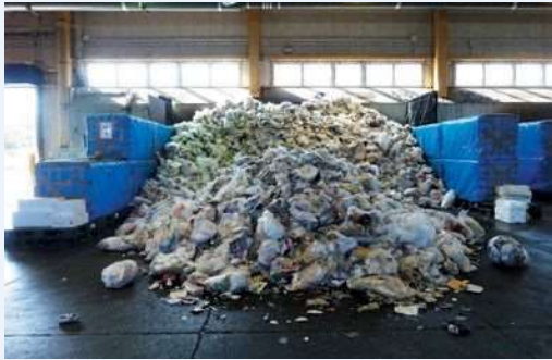
あつめられたプラスチック資源