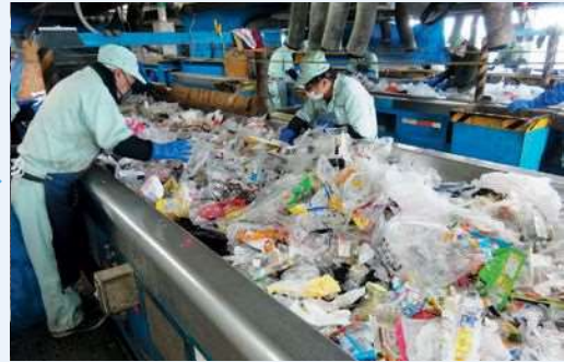
選別して異物を取り除く