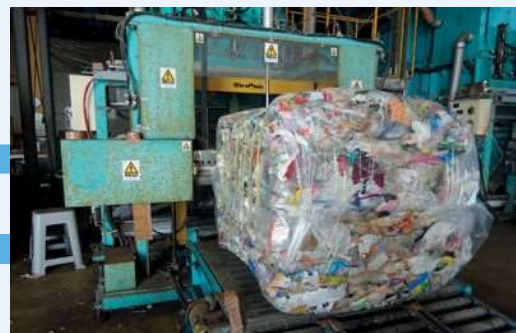
つぶしてかたまりに