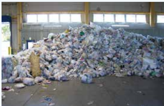
あつ 集められた プラスチック製容器包装