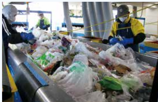
せん べつ 選別して異物を取り除きます。