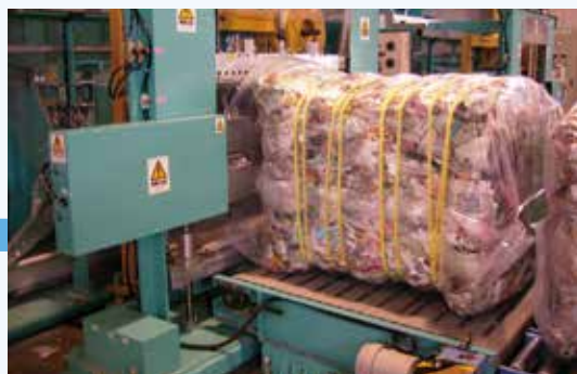
かたまりにしてしばります。