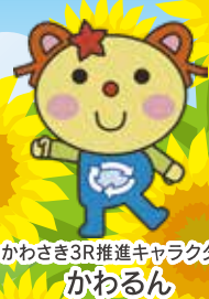
かわさき3R推進キャラクター かわるん