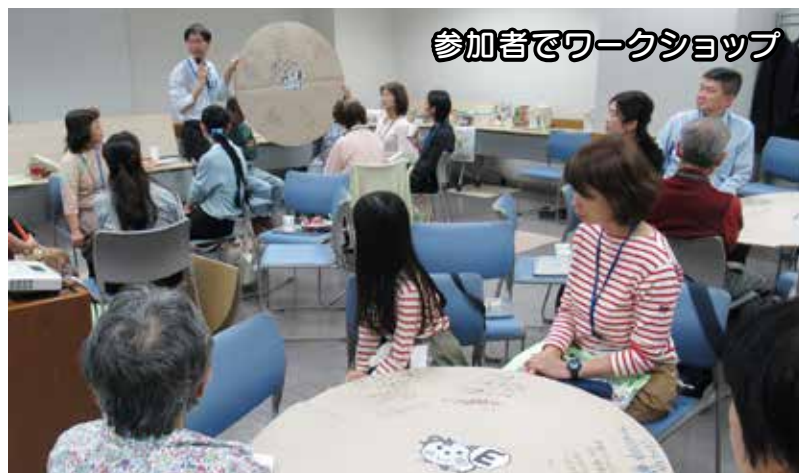
参加者でワークショップ