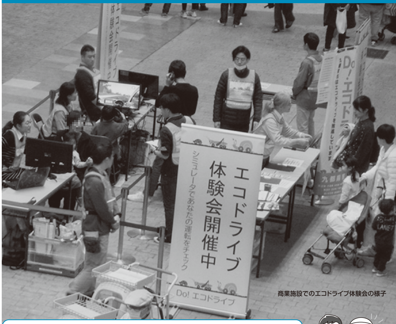
商業施設でのエコドライブ体験会の様子

いつでも、どこでも、誰にでも実践できるのがエコドライブ。 環境にやさしいだけでなく、燃料代の節約や、交通事故の減少にも効果があります。