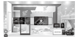
— 出展者ブース(イメージ) —

会社概要や製品・サービスの資料などを閲覧でき、問い合わせフォーム等により出展者へアプローチすることが可能です。