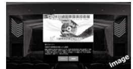
— 講演会場(イメージ) —

最新の世界の気候変動政策やSDGs、コロナ後の社会をテーマとした基調講演やセミナー・フォーラムを視聴することができます。一部を除き、オンデマンド配信となりますので、会期中はいつでも、どこでも、何度でも視聴が可能です。