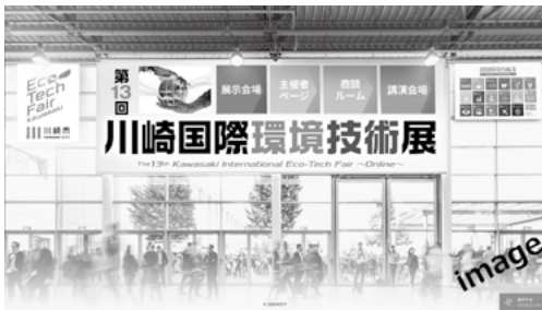
— エントランスページ(イメージ) —