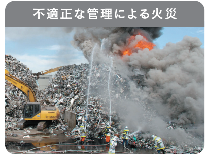
不適正な管理による火災

廃家電は電池やプラスチックを含むため、発火・延焼の危険性があり、不適正な管理による火災が発生しています。