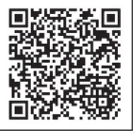
▲ 資源物・ごみの収集状況について

台風や地震などの災害時には、事前に資源物・ごみの収集状況についての案内や、災害廃棄物の出し方を随時案内するなど色々な情報が発信されます。情報の取り方を今一度確認しておいてください。市のホームページでは、災害時に「緊急情報」を大きく表示してお知らせします。また、地域ごとの収集状況は「資源物・ごみの収集状況について」で常時お知らせしています。