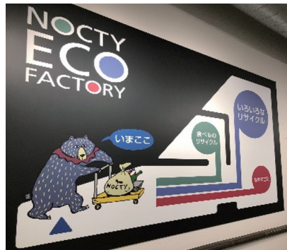
エコファクトリー案内図

第2回ごみゼロカフェでは、マルイファミリー溝口・ノクティプラザのバックヤード「エコファクトリー」の見学をはじめ、商業施設の地域環境への取組を学びました。その後、参加者のみなさんでワークショップを行い、見学や講演で感じたこと・学んだことを意見交換しました。