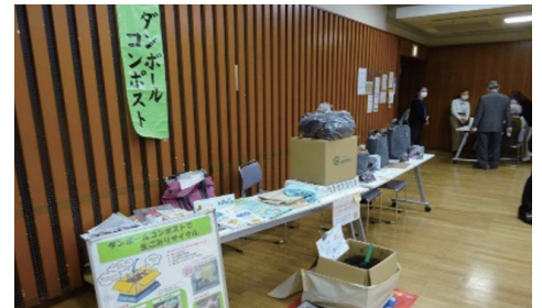
ダンボールコンポストの紹介