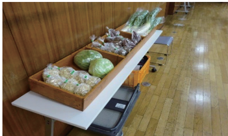
たい肥を使って育てた野菜