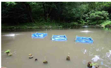
実証試験場所の提供(市有地の貸与)、 水質測定の実施