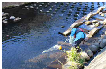
市内河川での測定時における 各種調整支援