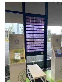
施設敷地内での環境技術設置 における各種調整