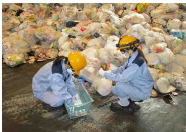
研究用サンプルの提供