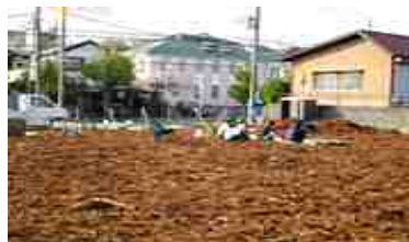
市有地の貸与及び 連携体制の構築支援・仲介