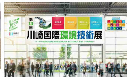
川崎国際環境技術展等での 情報発信の実施

※場合によってはご希望に添えないこともあります。具体的に提供可能な資源については市との協議により決定します。