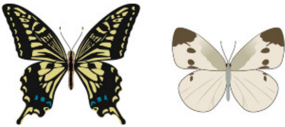
アゲハやモンシロチョウなど