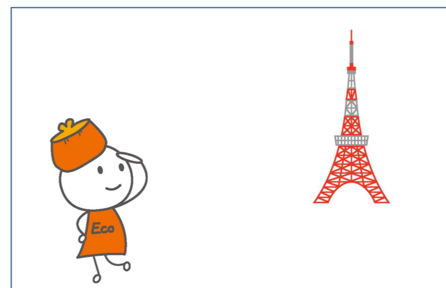
ちょうさをしているようす