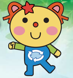
かわさき3R推進キャラクター かわるん