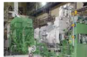
蒸気タービン発電機

ごみ焼却で発生した余熱 を活用し、蒸気タービン発 電機による 自立運転が可能 (一般家庭13,000世帯分の電気)