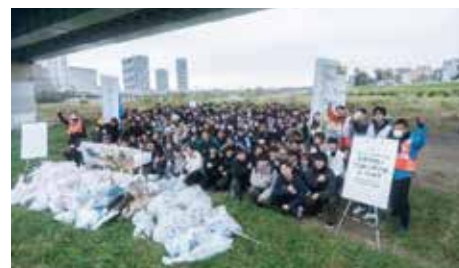
※イベント共催・写真提供「豪田ヨシオ部」