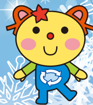
かわさき3R推進キャラクター かわるん