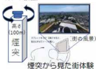
煙突から見た街体験