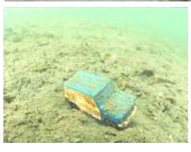
海底で見つかったおもちゃ