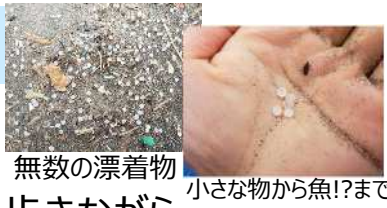
無数の漂着物 小さな物から魚!?まで

浜辺に打ちあがった 不思議な漂着物を カワスイさんと実際に歩きながら 観察するよ