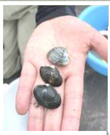
アサリを知る教室