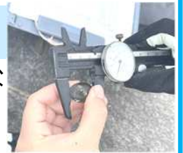
アサリの計測もするよ