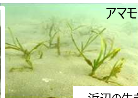
浜辺の生きものとのふれあい