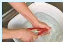
适当冲洗 请利用洗碗的剩水等