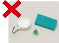
冰箱磁贴等（小金属物）