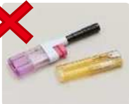
打火机等（普通垃圾、小金属物）