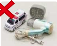
钟表、电吹风、玩具等（小金属物）