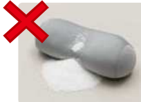
珠子靠垫等（普通垃圾）