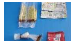
袋装物品可以通过捆绑或折叠，使其更紧凑。