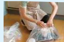
装入透明或半透明的口袋里丢弃