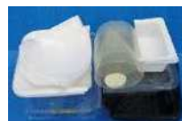
通过折叠或剪切使其体积更小！（使用剪刀等工具时要小心，不要剪到自己的手）。