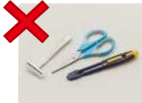
剪刀、裁纸刀等（小金属物）