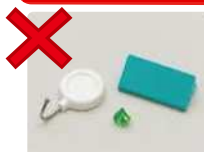
Ímãs de geladeira, etc. (Pequenos metais)

Não descarte itens que contenham baterias de íons de lítio