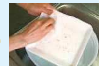
limpe a sujeira