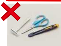
Tesouras, estiletes, etc. (Pequenos metais)