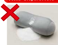
Almofadas, etc. (Lixo comum)