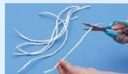
Cordas de vinil, etc.