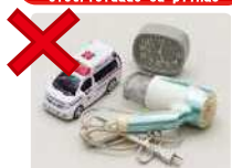
Relógios, secadores de cabelo, brinquedos, etc. (pequenos metais)