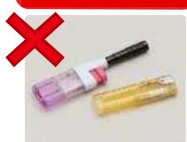
Isqueiros, etc. (Lixo comum, pequenos metais)