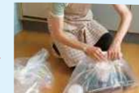
Coloque em um saco transparente ou semitransparente

(Use a água que sobrou da lavagem da louça.)