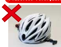
Capacetes, etc. (Lixo comum)

Outros itens (Materiais com risco de contaminação (kits de teste de antígeno, etc. /Lixo comum), Agulhas (resíduos médicos domiciliares) Tecidos (coleta coletiva de materiais, lixo comum) Borracha (lixo comum), Produtos plásticos com mais de 50 cm (lixo de grande porte)