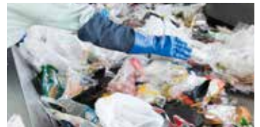
수작업을 통한 선별 공정

오염된 것이나 냄새가 심한 것도 수거하여 시설에서 대응하고 있으므로 확실하지 않으면 “플라스틱 재활용품”으로 배출해 주십시오.