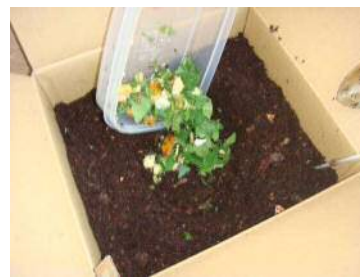
②真中に穴を掘って 生ごみを投入！