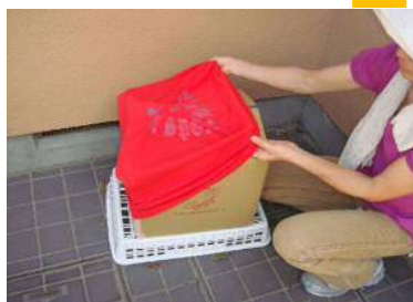
④カバーをかけて完了！