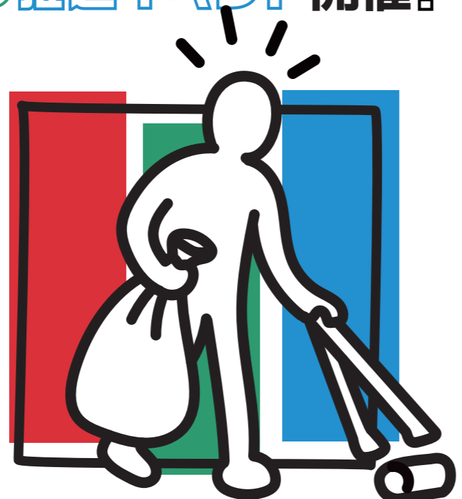
Kawasaki 100th Anniversary Project